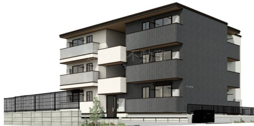
※完成予想図のため、実際とは多少異なる場合があります。掲載は実際の状態と異なる場合があります。