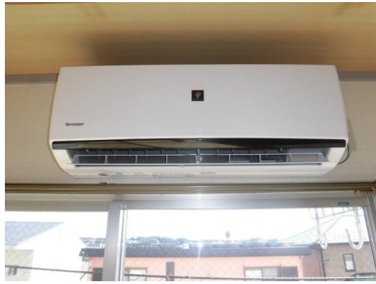
図面と現況が異なる場合は現況が優先となります。